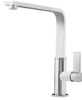
龙头 NYC 8486 000