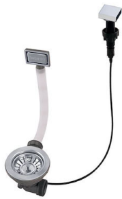
自动下水 - PM 8407 113